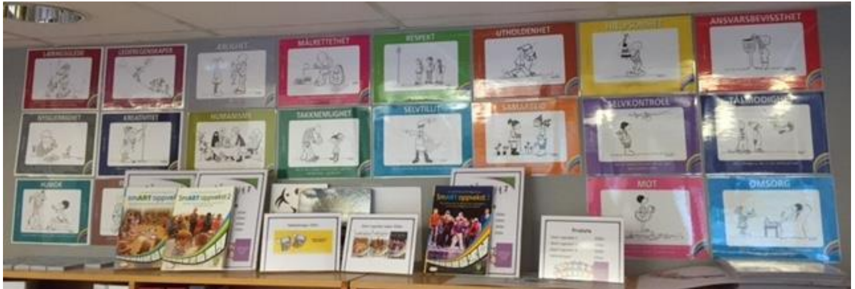
Veggen i 3. etasje i kommunehuset